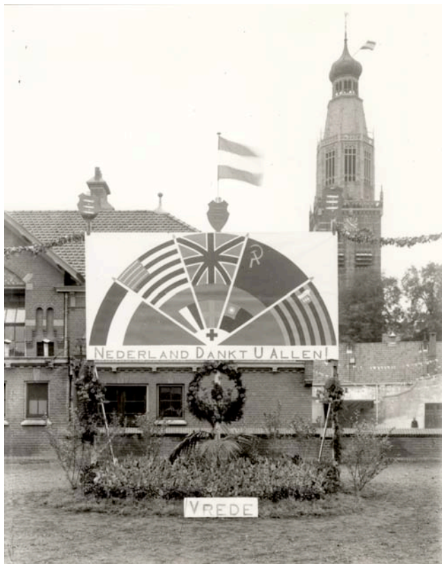
Gedenkteken uit 1945, opgericht op het Boschplein bij de voormalige lagere school.